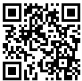
◀「AIR エアホッケー」紹介動画

AIRエアホッケーは、センサーにより“AIR”=非接触でおこなうデジタルゲームです。ボールを打ち合い得点数を競うゲーム性、身体を動かすスポーツ性、そしてデジタルならではの演出効果をお楽しみいただけます。